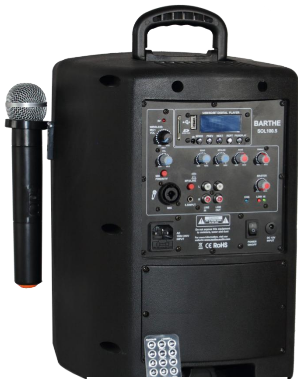
Modèle présenté : SOL50.5UB Non contractuelle